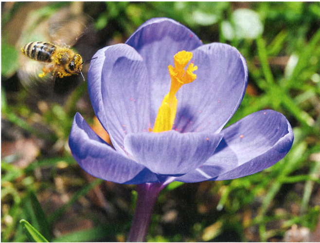
Net voor de landing op een krokus.